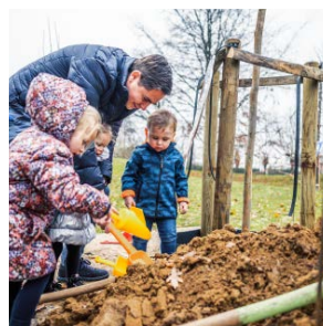
Weetjes Pagina 13