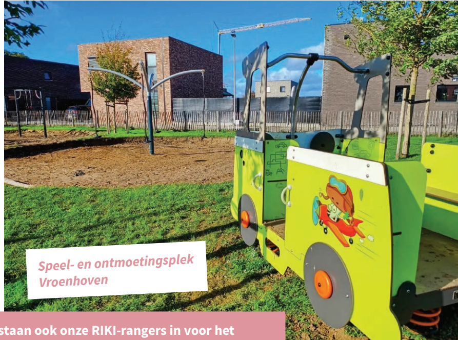
Speel- en ontmoetingsplek Vroenhoven

Ons nieuwste project is het speelplein in Vroenhoven , waar momenteel de laatste hand gelegd wordt aan de renovatiewerken. Onze jongste inwoners kunnen er volop ravotten terwijl (groot)ouders een babbeltje slaan. De volgende projecten op de planning zijn een speel- en ontmoetingsplek in Lafelt en een skatepark in Vlijtingen.