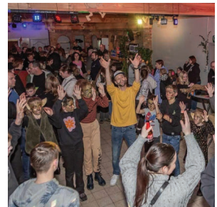
UiT In Riemst Pagina 8 - 10