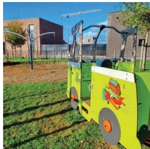
Spel en ontmoeting in Riemst Pagina 6