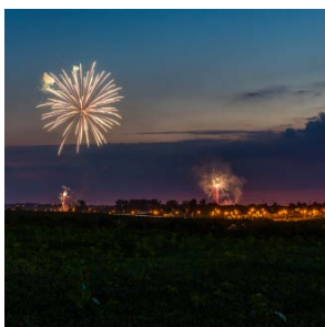
Vraag & Antwoord Pagina 11

Wat vind je ervan? Laat het ons weten via communicatie@riemst.be .