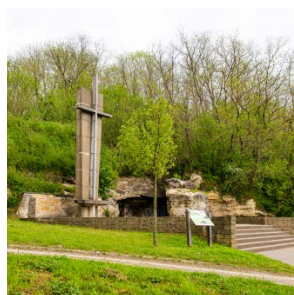
65ste herdenking Roosburgramp Pagina 12