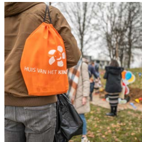
Samen sterk: Huis van het Kind en het JAC Pagina 7