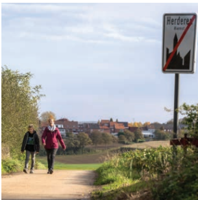
Levenslang wonen in Riemst Pagina 4 - 5